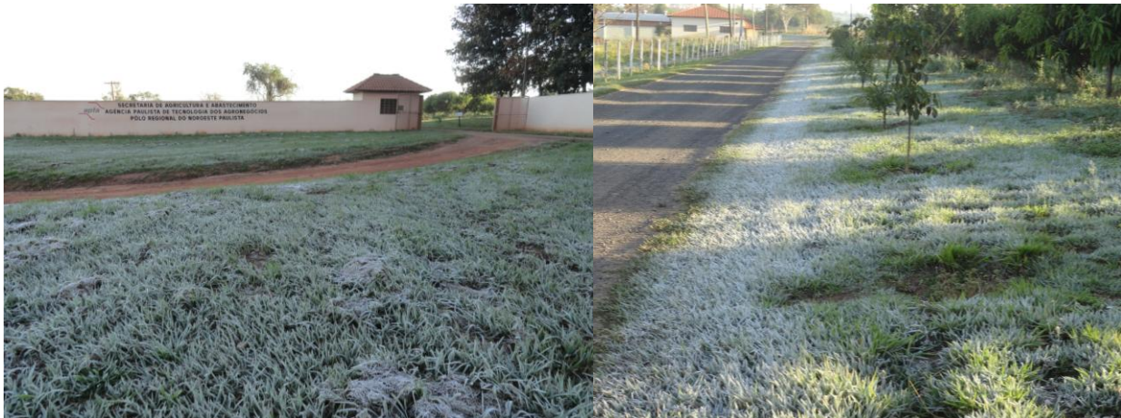
Figura 1. Entrada do Polo Regional Noroeste Paulista em 28/08/2011, com detalhes da geada. Votuporanga, SP.

Na Estação Meteorológica do IAC, a 300 metros da área experimental, foi registrada a temperatura de 2,2°C e a ocorrência de geada branca na referida data (Figura 1). A diferença entre a temperatura medida no abrigo termométrico (1,5 m de altura) e a medida realizada na relva varia de 3,3° a 7°C (SILVA & SENTELHAS, 2001; GRODZKI et al., 1996). Isso explica a formação de gelo, mesmo com registro da temperatura acima de zero no abrigo termométrico.