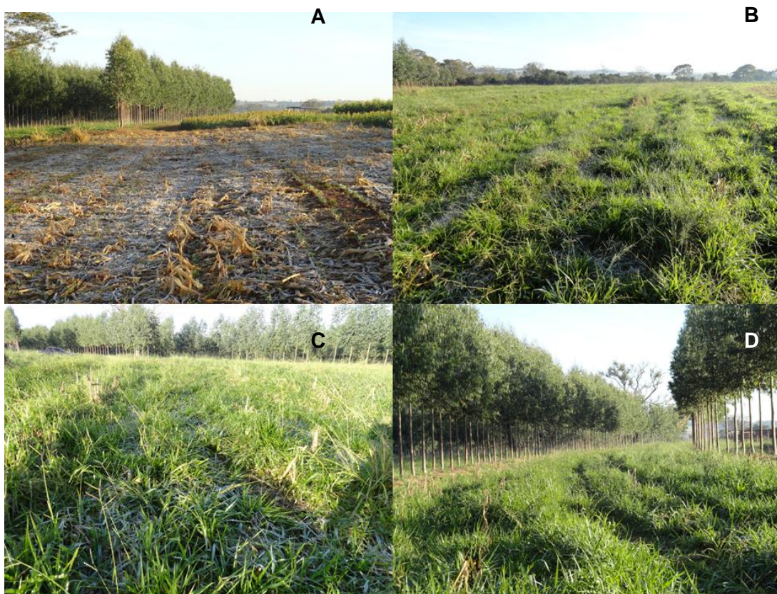
Figura 2. Detalhes da área experimental. A - área de sistema semeadura direto; B - área em integração lavoura-pecuária (ILP); C - área ILP; D - interior da área sob Sistema Integração-Lavoura-Silvipastoril (ILPS).

O microclima gerado devido à presença do estrato arbóreo, também, favorece a retenção de umidade e o enriquecimento de nutrientes, podendo refletir no prolongamento da disponibilidade de forragem verde. Em termos práticos, frequentemente, verifica-se a ocorrência de pastagens verdes sob árvores mesmo durante o inverno (SILVA, 1998).